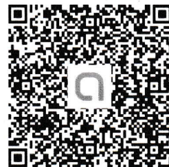
สอบถามเพิ่มเติมแอดไลน์