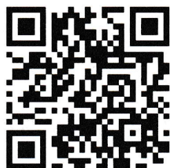
กรอกข้อมูลสมัครงาน