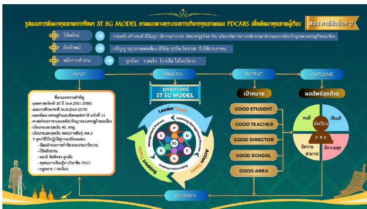
ภาพที่ 1 รูปแบบนวัตกรรมการพัฒนาคุณภาพการศึกษา 3T 5G Model ตามแนวทางกระบวนการบริหารคุณภาพแบบ PDCARS เพื่อพัฒนาคุณภาพผู้เรียน

รูปแบบนวัตกรรมการพัฒนาคุณภาพการศึกษา 3T 5G Model ตามแนวทางกระบวนการบริหารคุณภาพแบบ PDCARS เพื่อพัฒนาคุณภาพผู้เรียน สำนักงานเขตพื้นที่การศึกษาประถมศึกษากาฬสินธุ์ เขต 2 มีกรอบแนวคิด ดังนี้