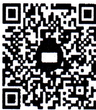
ลงทะเบียนตอบรับเข้าร่วมประชุม

หมายเหตุ การแต่งกายผู้เข้าร่วมประชุมสวมกางเกงหรือชุดกีฬา