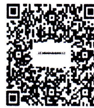
เอกสารประกอบการประชุม