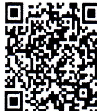
Join Zoom Meeting Meeting ID: 920 3425 7977 Passcode: 787256