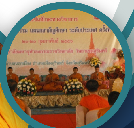
งานทักษะทางวิชาการ กรม แผนกสามัญศึกษา ระดับประเทศ ครั้งที่ ๒๐-๒๑ กุมภาพันธ์ ๒๕๖๖ วิทยาลัยมหาจุฬาลงกรณราชวิทยาลัย วิทยาเขตสุรินทร์ ตำบลนอกเมือง อำเภอเมืองสุรินทร์ จังหวัดสุรินทร์