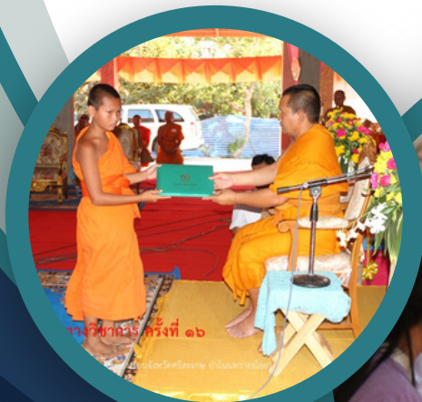
งานวิชาการ ครั้งที่ ๑๖

ณ ศูนย์ปฏิบัติธรรมวัดกลางสุรินทร์ ตำบลเจดีย์อง อำเภอมืองสุรินทร์ จังหวัดสุรินทร์