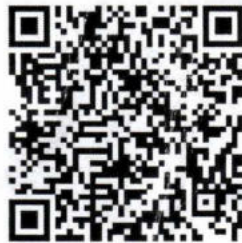
QR CODE สำหรับสมัครประกวด