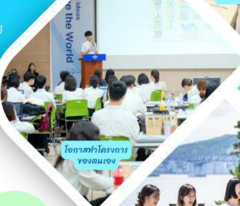
โอกาสทำโครงการ ของตนเอง