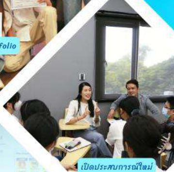
เปิดประสบการณ์ใหม่