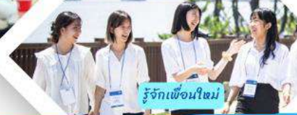
รู้จักเพื่อนใหม่