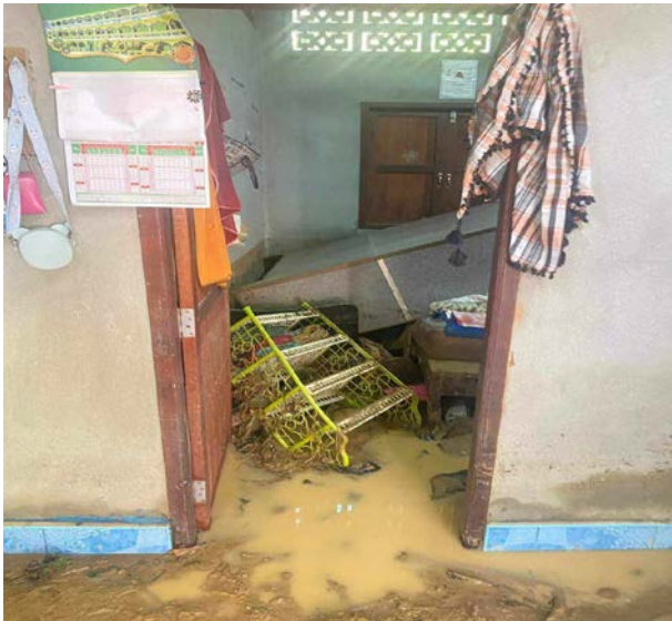
2. เด็กหญิงนุรอาซีกัน แวดอยี