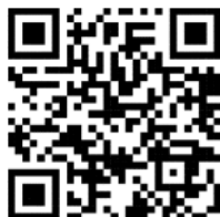
(QR Code หมายเลข 5)

2) คู่มือการใช้งานโปรแกรมบันทึกข้อมูลสำหรับแบบคัดกรองเพื่อสนับสนุนการเลี้ยงดูเด็กตามมาตรฐานขั้นต่ำ (CMST)