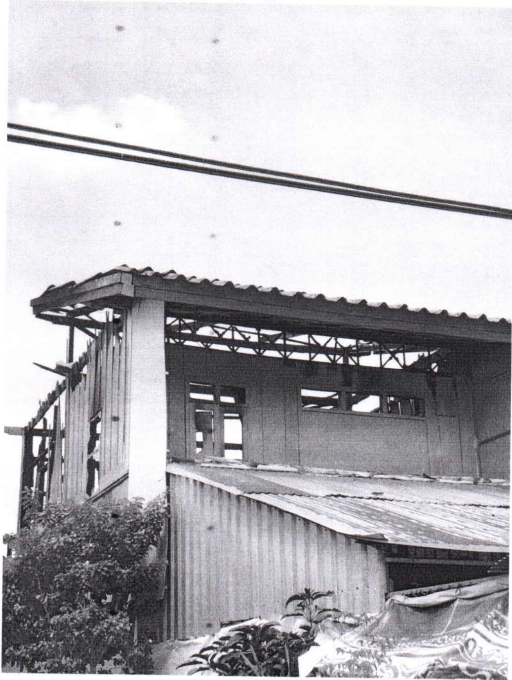
ภาพถ่ายความเสียหาย เมื่อวันศุกร์ ที่ ๒๓ มิถุนายน ๒๕๖๖