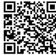
QR Code Facebook ศกศ.จบ.